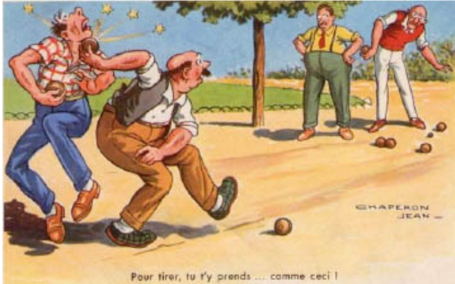
Pour tirer, tu t'y prends ... comme ceci !

l'APCO vous propose un TOURNOI DE PETANQUE AU PARC GASCOIN !!!